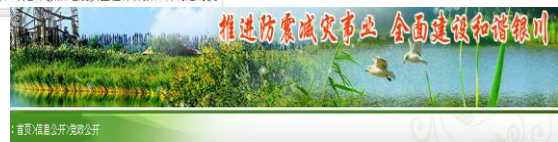
银川市“部分审批改备案”改革实施方案

及其法律依据、实施主体、运行流程、监督方式等信息。对于承担的行政审批事项，发布了服务指南，设定依据、申请条件、申请材料、基本流程、审批时限、收费依据及标准、注意事项等内容。