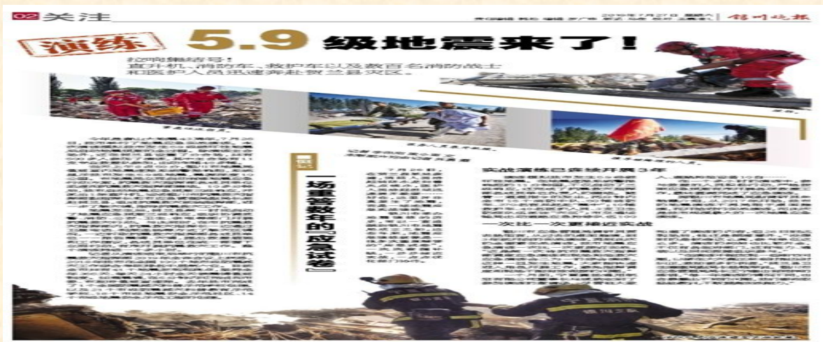
图5 银川晚报关于银川市地震应急演练的相关报道