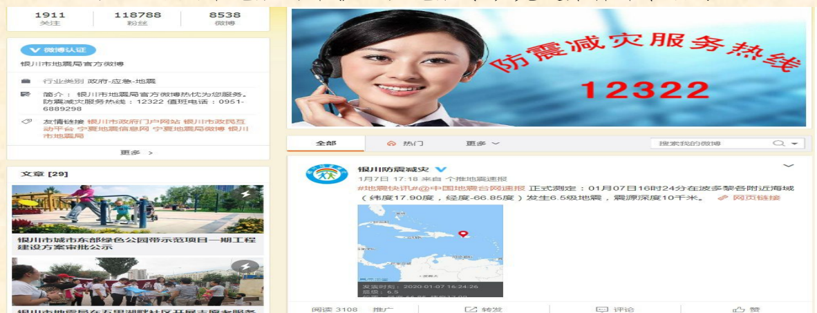
图3 银川市地震局官方微博@银川防震减灾