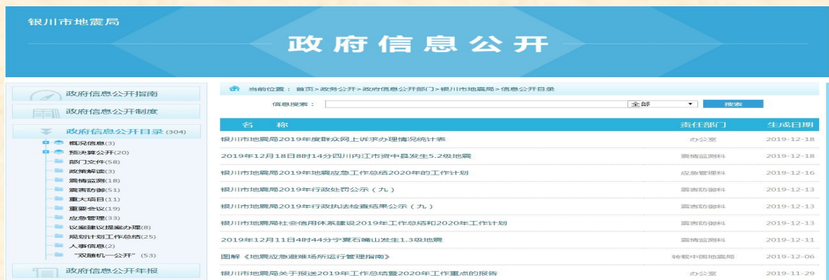
图 1 银川市政府门户网站政务公开栏目银川市地震局政府信息公开

2019 年,银川市地震局以习近平新时代中国特色社会主义思想为指导,全面贯彻党的十九大和十九届二中、三中、四中全会精神,深入落实党中央、国务院和自治区关于全面推进政务公开的系列部署,紧紧围绕市委市政府中心工作及群众关注关切,以公开明权责、以公开促规范,着力提升政务公开质量、提升公众参与度、提升公开服务效果,为建设法治政府、透明政府、服务型政府发挥积极作用。