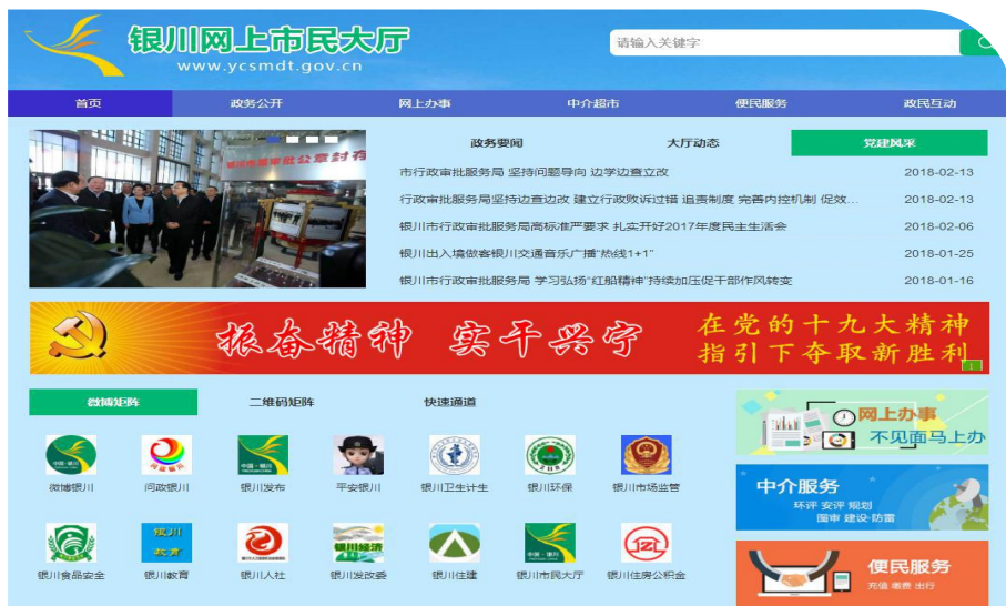
—银川网上市民大厅网站—

3. 在网络媒体、平台搭建上求突破。升级“银川市行政审批服务局”网站功能和上线“网上市民大厅”，在网站上