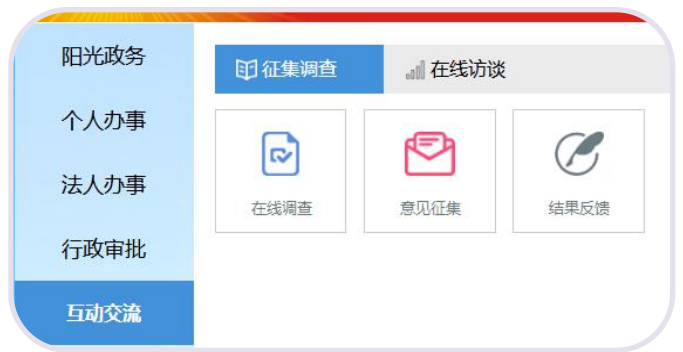
—银川市行政审批服务局网站政民互动—

4. 线上线下深度融合，创建“全景式”政务公开。通过“互联网+政务服务”新模式，将实体大厅“搬”到网上，设置“政务公开”、“网上办事”、“中介超市”、“便民服务”、“政民互动”五大功能模块，汇集 51 个进驻部门（窗口）的 1000 余项行政审批、公共服务事项及微信、微博账号，