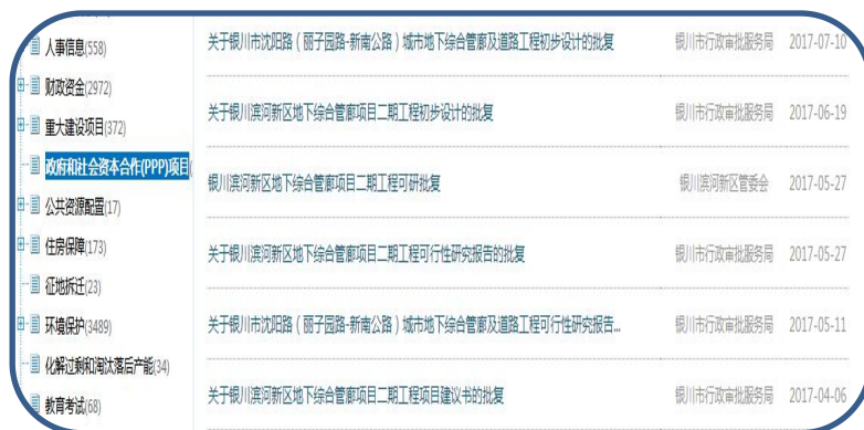
—银川市政府网站 PPP 项目公开—

1. 积极主动公开重大建设项目信息。 加大重大建设项目批准的信息公开工作力度，对涉及全市经济社会发展的重要改革方案、重大政策措施、决策部署、规划、重点工程项目等，决策前进行合法性、合理性、可行性评估，凡涉及人民群众利益的，必须通过社会公示或听证会等形式听取意见和建议，并及时反馈情况采纳意见，确保行政决策公开透明。