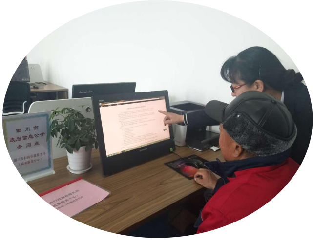
—查阅点指导申请人查阅政府信息—

2. 在基础服务、场所建设上出实招，加强政务公开查阅场所建设，方便群众查询政府信息。行政审批服务局不断拓宽公开渠道，进一步加强查阅场所建设。在银川市行政审批服务局（政务服务中心）政务公开查阅点