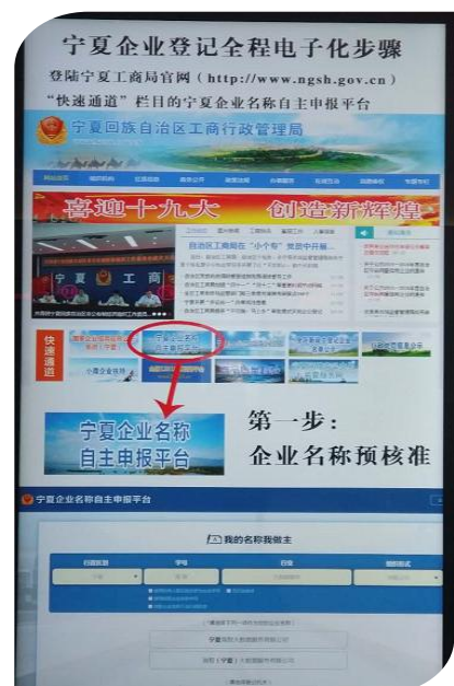
—大厅电子显示屏公开办事流程—

目前，市民大厅设立400多个服务窗口为市民和企业提供1000多项审批及服务事项，所有单位、窗口设置政务公开栏、电子显示屏、电子触摸屏、服务引导台、窗口、电话等，将单位职责权限、办事指南、办事依据、办事程序、办事结果、收费项目和标准以及服务承诺等予以公