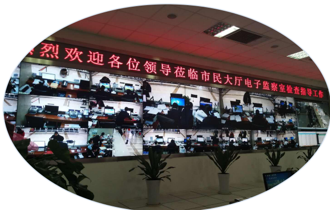
—电子监察室全程督办—

三是强化监督考核促政务公开落实到位。建立电子监察系统，对审批实施全方位无盲点的监控监察和督查督办。通过审批服务系统的电子监察功能，对审批的过程，包括受理、审核、批准、时限等，进行同步全程监控，确保审批要件齐全，审批环节规范，按照承诺时限办结，防止违规办件的出现；利用电子视频监控