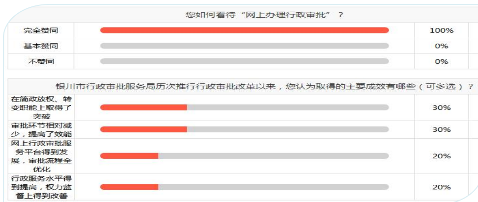
—银川市行政审批服务局在线调查—

提供网上查询、预约、申办功能，网上审批事项 404 项，占全部事项的 81%，比去年增加了 30%以上。